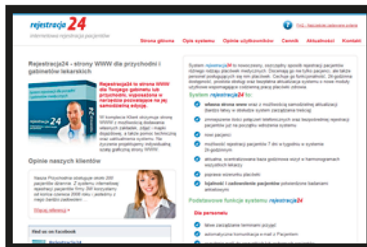
Widok strony głównej serwisu www.rejestracja24.net

System ten tworzą niezależne serwisy WWW placówek medycznych, za pośrednictwem których pacjenci tych placówek mogą umawiać się na wizyty lekarskie i badania. Cechuje go funkcjonalność, całodobowa dostępność, prostota obsługi oraz bezpłatna aktualizacja systemu o nowe moduły użytkowe wspomagające codzienną pracę placówki zdrowia.