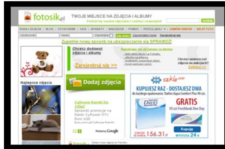
Widok strony głównej serwisu Fotosik.pl

Bardzo często wykonywali optymalizację zapytań do bazy danych o skomplikowanej składni.